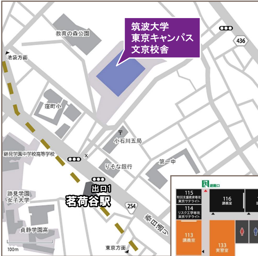
筑波大学 東京キャンパス 文京校舎 会場周辺地図